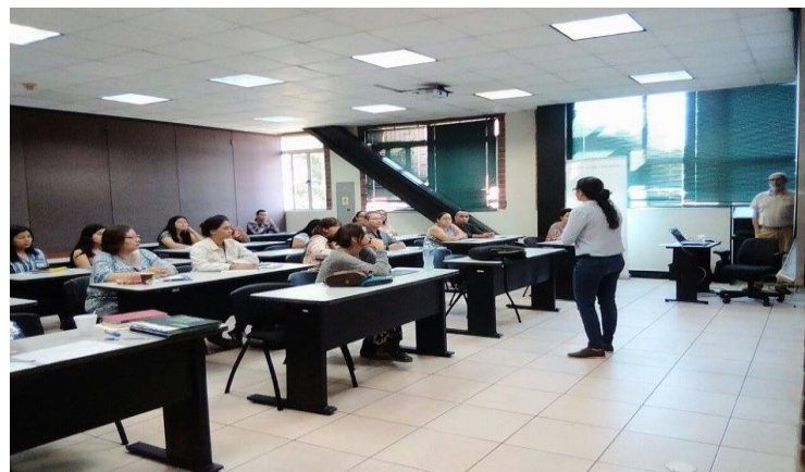
Comunicaciones SSPAS (2017). “Inicio del Tercer Diplomado Derechos Humanos e Incidencia SSPAS/IDHUCA.”. Fotografía.

La situación de derechos humanos en El Salvador ha reclamado la necesidad de fortalecer y potenciar capacidades de activistas y personas defensoras de estos, especialmente los esfuerzos dirigidos a mejorar la protección y la garantía de los derechos de poblaciones en situación de vulnerabilidad, como la niñez, la adolescencia, la juventud, las mujeres, los pueblos indígenas, la población LGBTI, entre otros.