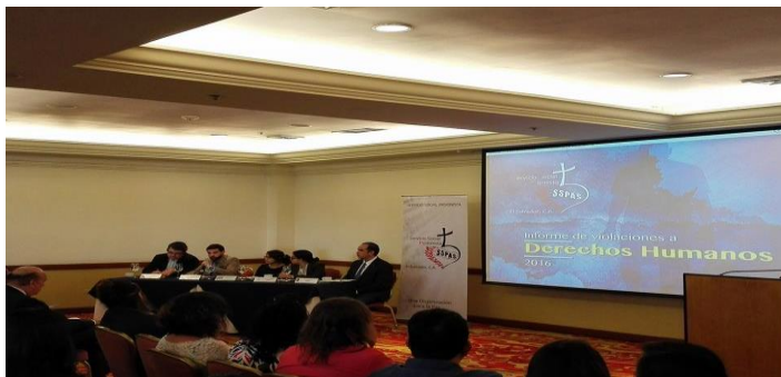
Comunicaciones SSPAS (2017). "Presentación de Informe de Violaciones a Derechos Humanos 2016". Fotografía

El 14 de junio de 2017, el Observatorio de Derechos Humanos "Rufina Amaya" presentó el Informe de Violaciones a Derechos Humanos 2016 , en el que se recaban los casos de violaciones a derechos humanos registrado durante el año 2016 por el Observatorio del SSPAS. El Informe recoge 46 casos de violaciones a derechos humanos donde la Policía Nacional Civil se ve involucrada en la mayoría de estos. Las modalidades de vulneración a derechos humanos que el Informe presenta van desde intimidaciones y amenazas hasta casos de tortura y detenciones arbitrarias, de las cuales sigue siendo la población joven la más afectada.