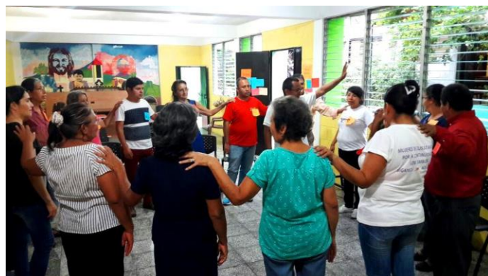
Comunicaciones SSPAS (2017). "Primer Curso Básico de Derechos Humanos y Cultura de Paz". Fotografía

La primera línea se retoma la estrategia de sensibilización del Cursos Básico de Derechos Humanos y Cultura de Paz que en el 2016 fue la primera experiencia con resultados positivos. Además, se contribuyó a fortalecer conocimiento para el caso de violencia sexual hacia mujeres y a la niñez.