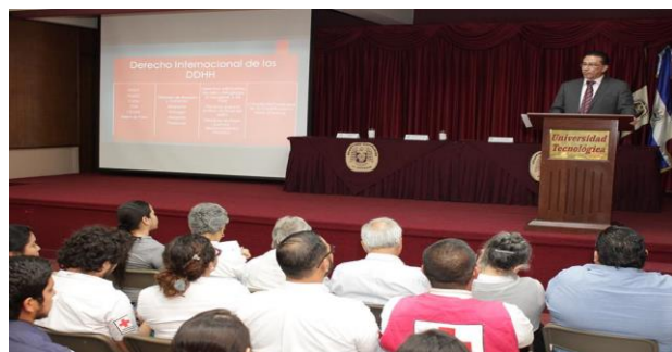
Comunicaciones SSPAS (2017). "Presentación de Informe Sobre Desplazamiento Forzado por violencia y crimen organizado en El Salvador 2016." Fotografía

Se presentó el informe sobre Desplazamiento Forzado en el Salvador, el informe se elabora a partir de los insumos provenientes de los casos específicos registrados por organizaciones que integran la Mesa de Sociedad Civil Contra Desplazamiento Forzado, del cual el Servicio Social Pasionista forma parte a través del área de Derechos Humanos.