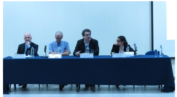
Comunicaciones SSPAS (2017). Resultados de la investigación “Inseguridad y violencia en El Salvador. El impacto en los derechos de adolescentes y jóvenes del municipio de Mejicanos”. Fotografía

El Área de Derechos Humanos presentó los resultados de la investigación: “Inseguridad y violencia en El Salvador. El impacto en los derechos de adolescentes y jóvenes del municipio de Mejicanos”, el mes de enero de 2017. Esta investigación contiene un análisis de las políticas de seguridad del actual gobierno, el contexto de violencia y criminalidad en el país, el marco normativo de los derechos humanos de la población adolescente y joven, así como la presentación y el análisis de los resultados obtenidos a partir de consultas directas con población del municipio de Mejicanos respecto al ejercicio de sus derechos y las vulneraciones a estos por parte de la Policía Nacional Civil y la Fuerza Armada.