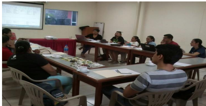
Comunicaciones SSPAS "Mesa por el Derecho a Defender Derechos". Fotografía

Participación en el espacio de la Mesa por el Derecho a Defender Derechos que impulsó una propuesta de Ley de Protección Integral para Personas Defensoras de Derechos Humanos y buscar un plan de incidencia que comprende realizar una campaña de sensibilización del rol de la persona defensora, además diseñar una estrategia que garantice la aprobación, de la propuesta de Ley de protección a las personas que defienden Derechos Humanos.