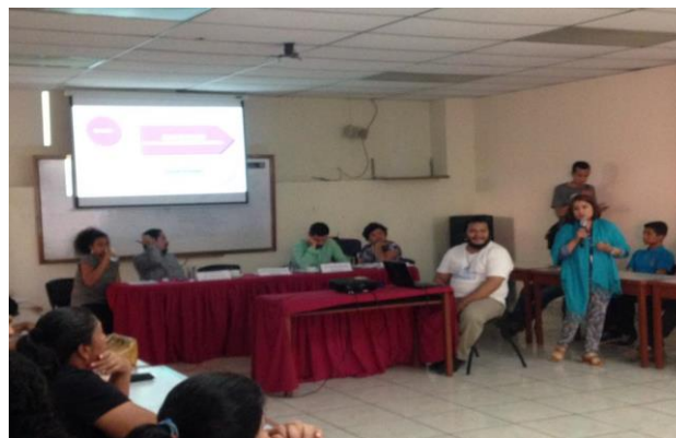
Comunicaciones SSPAS, "Jornada de información en casos de violación a Derechos Humanos". Fotografía

La organización Azul Originario (AZO), FESPAD, IDHUCA y EL SSPAS, realizaron la Primera jornada Informativa sobre "¿qué hacer en casos de violación a derechos humanos?", por parte de agentes estatales, con la finalidad de dar a conocer a las y los participantes, algunos mecanismos que se pueden tomar en caso de ser víctimas de violación a sus derechos humanos.