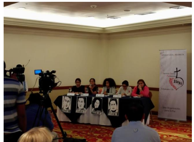
Comunicaciones SSPAS (2017). "Conferencia de Prensa Movimiento Los Siempre Sospechosos de Todo". Fotografía

Previo a la Presentación del Informe, El Servicio Social Pasionista, el Movimiento Los Siempre Sospechosos de Todo y la Asociación Azul Originario, realizaron una conferencia de prensa, sobre la alarmante situación de violencia, acoso, vulneración de derechos y estigmatización que las juventudes y la sociedad salvadoreña están viviendo.