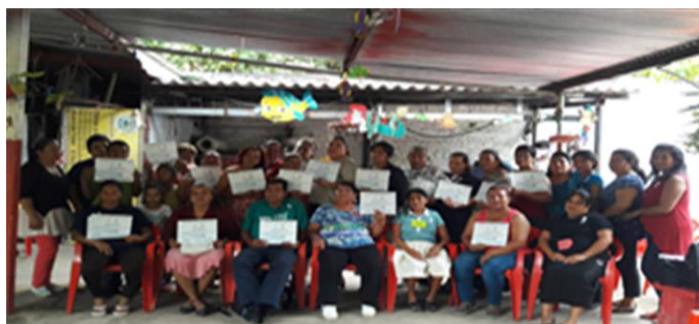
Comunicaciones SSPAS (2016). “Curso Básico de Derechos Humanos y Cultura de Paz”. Fotografía.

El curso inició el 12 de Noviembre y se concluyó el 26 de noviembre, se contó con la participación de un total de 23 personas (19 mujeres, 4 hombres). Las comunidades participantes en el taller fueron Lirios del Norte, Arca de Noé, Sinaí, Montecarmelo, San Rafael, La Paz, Los Hernández, Arenales, Tepito, entre otras.