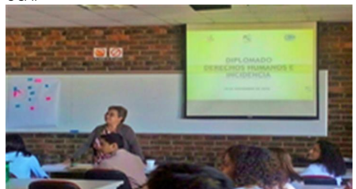
Comunicaciones SSPAS (2016). Primera Jornada, Modulo I “ Diplomado de Derechos Humanos e Incidencia ” Fotografía

Desde el Área de Derechos Humanos del Servicio Social Pasionista (SSPAS) se busca la formación técnica a defensoras y defensores brindándoles herramientas teóricas y prácticas que apoyen su labor en la defensa de derechos humanos, a través de mecanismos de protección a nivel nacional, con fuerte énfasis en los mecanismos internacionales. Por ello, el 18 de noviembre de 2016 inició el “ Diplomado de Derechos Humanos e Incidencia ”, que finaliza 17 de febrero de 2017. Este proceso formativo se realiza junto a la experiencia del Instituto de Derechos Humanos de la UCA (IDHUCA) y la Fundación de Estudios para la Aplicación del Derecho (FESPAD), y cuenta con la certificación académica de la Universidad Centroamericana “José Simeón Cañas” UCA.