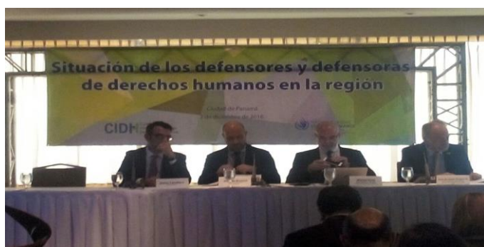
“Reunión de Defensores y Defensoras de Derechos Humanos”. Fotografía.