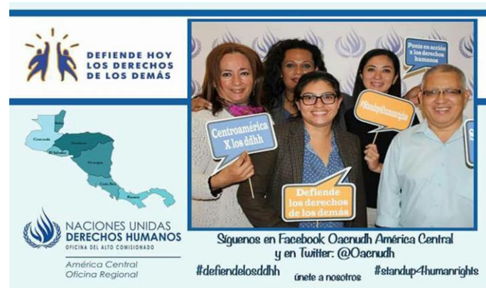
Oficina del Alto Comisionado de las Naciones Unidas (2016). “Reunión de Defensores y Defensoras de Derechos Humanos” . Fotografía.

En una segunda parte de la reunión se desarrolló un encuentro entre defensoras y defensores,