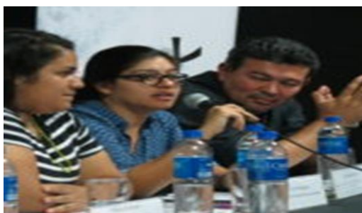
Comunicaciones – SSPAS (2016). documental: “ Más allá del estigma. Cultura de la violencia en El Salvador ”. Fotografía

Se realizaron otras actividades para la promoción del documental en espacios como la Universidad Francisco Gavidia (UFG) y la trasmisión del mismo en el canal TVX.