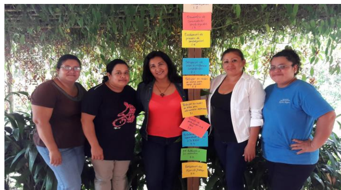
Comunicaciones SSPAS (2016). “Evaluación Final del Plan de Trabajo”. Fotografía

Para finalizar con las actividades el 13 de diciembre se llevó a cabo la jornada de “ Evaluación Final del Plan de Trabajo ”, donde se realizó un balance de lo desarrollado durante el año y una autoevaluación de las personas activas en la RPDH .